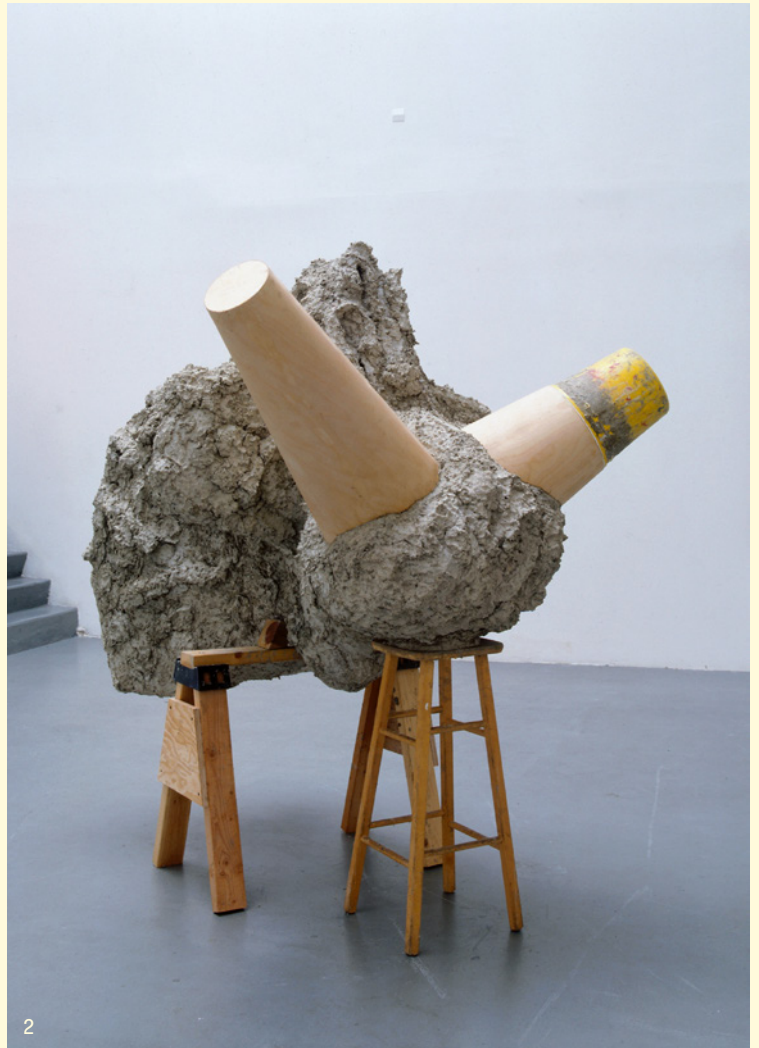
2. Mike Kelley , Spread-Eagle , 2000, Centre national des arts plastiques © The Mike Kelley Foundation for the Arts / Kelley Studio / Cnap.