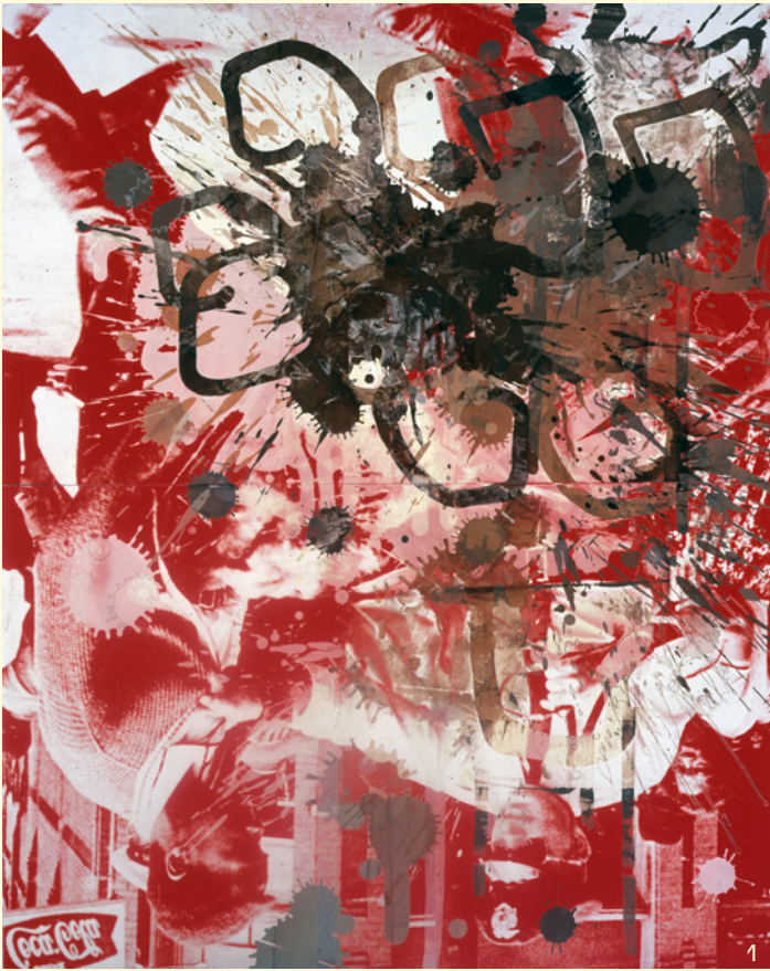
1. Kelley Walker, Black Star Press (Rotated 180 degrees) , Press Black Star, 2006, Centre national des arts plastiques © droits réservés / Cnap / photographie Paula Cooper Gallery.