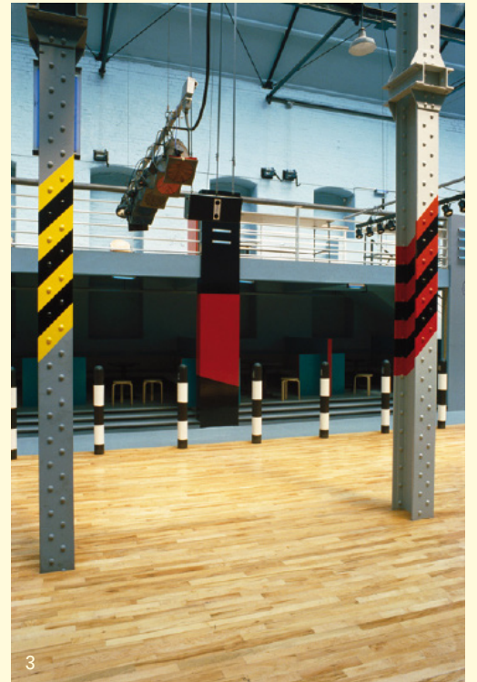
3. FAC 51 The Hacienda , Ben Kelly, Manchester UK.