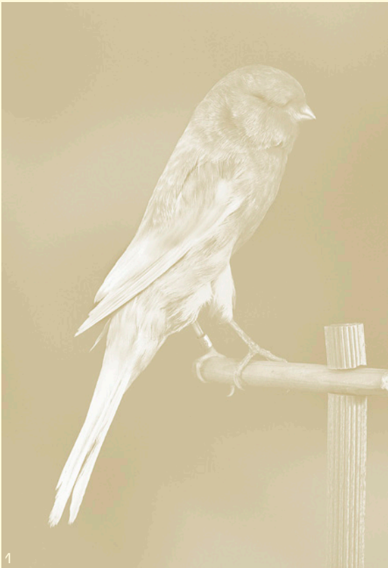
1. Carsten Höller , Canary , 2009, Centre national des arts plastiques © ADAGP, Paris 2016 / Cnap / photographie Galerie Air de Paris.