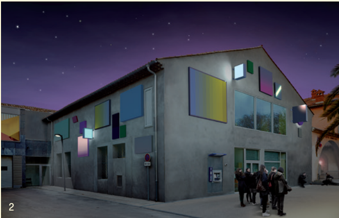
1 et 2. Bruno Peinado Il faut reconstruire l'Hacienda , 2016 Œuvre pérenne sur la façade de l'extension du Mrac Occitanie / Pyrénées-Méditerranée, Sérignan, réalisateur d'images YALA Yvon Arramounet Labiorte ADE © Bruno Peinado.