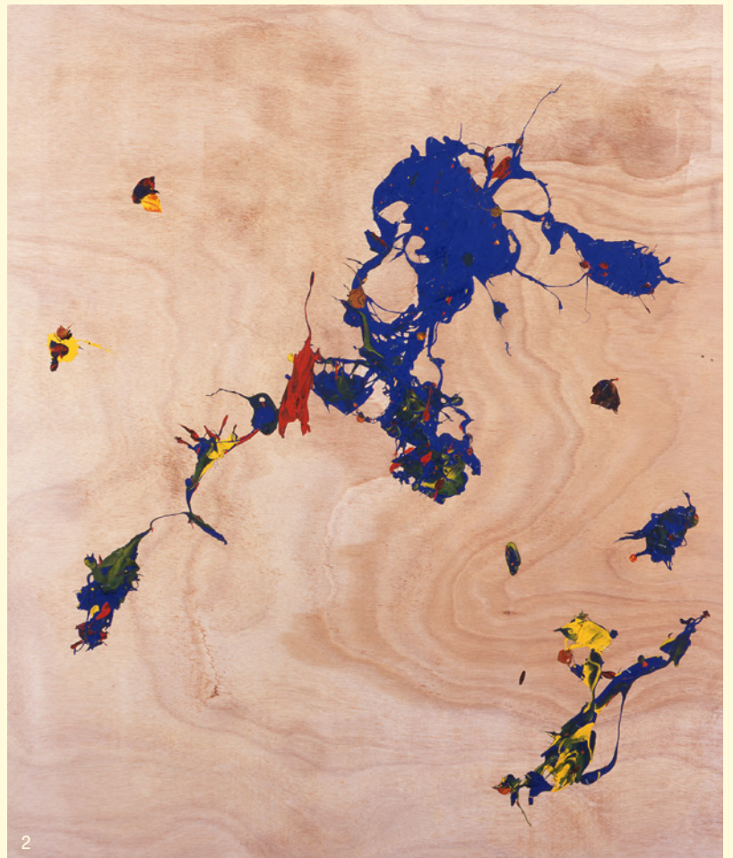
2. Jimmie Durham, Almost Spontaneous n°1 , 2004, Centre national des arts plastiques © Jimmie Durham / Cnap / photographie Yves Chenot.